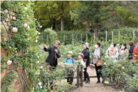
▲ローズガーデンガイドツアー