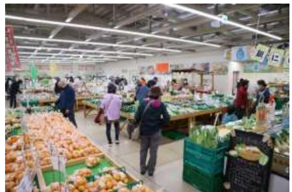
▲季節の味覚が並ぶ朝津味店内