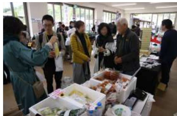
▲FFC すこやか物産展 (漬物製造者)