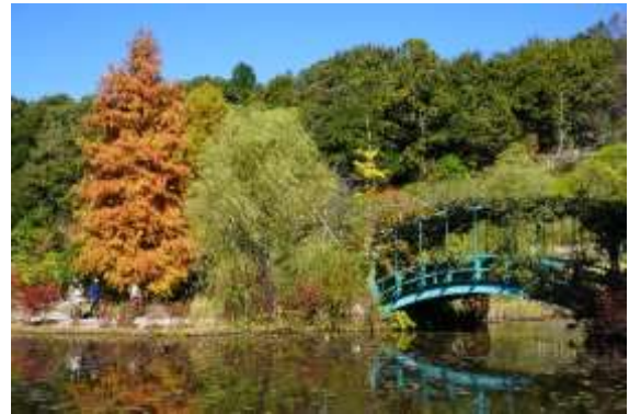
▲ラクウショウの黄葉