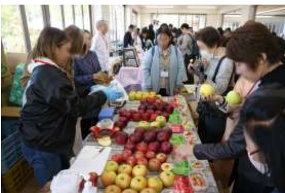
▲FFC すこやか物産展 (リンゴ生産者)