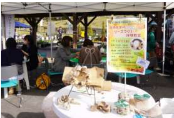
▲リース作り体験教室