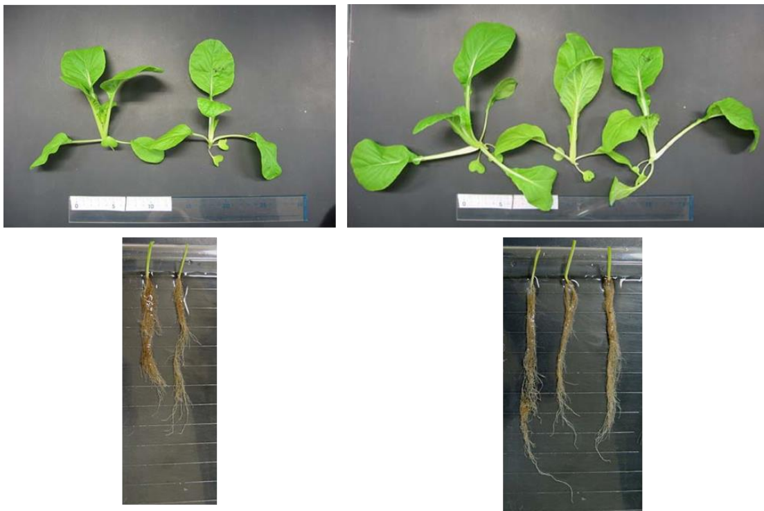
図1 適量灌水条件の播種3週間目のシロナ (左;対照区, 右;FFC エース区)