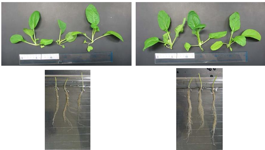
図2 半分量灌水条件の播種3週間目のシロナ (左;対照区, 右;FFC エース区)