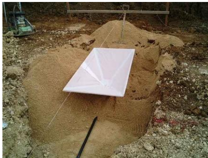
図 1 ロート型ライシメータの原型