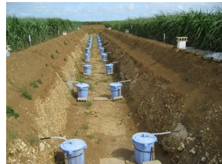
図 2 浸透水を集水するポリタンク